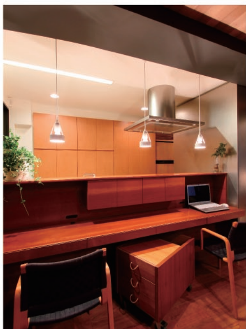
キッチンカウンターや収納などは、家具職人によってひとつひとつ 手作りされたもの。