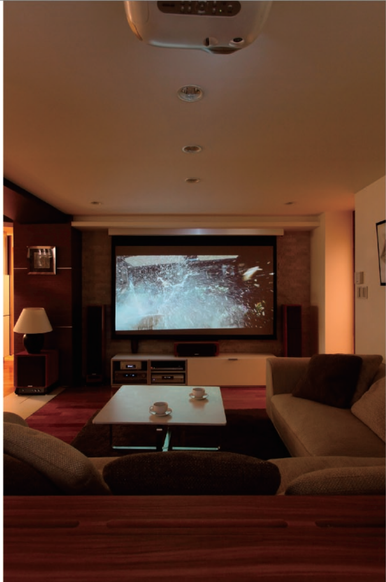
迫力の100インチスクリーン。設計段階で組み込むので、配線が見えることもない。

そんな「コムハウジング」の家づくり の片鱗を体感できるコンセプトルーム が十二月から公開されることになっ た。