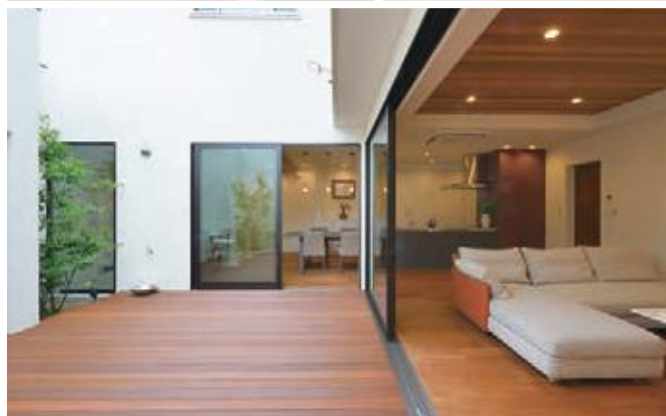
※広告掲載に間に合わなかった為、一部施工事例写真を使用しております。